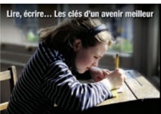
Lire, écrire... Les clés d'un avenir meilleur

Des questions ont été posées par les membres du club : quid du bonheur, risque de voir apparaître un « big brother » et qu'en est il des pays les moins avancés.